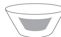
Teildekor/ partical cover 150 x 73 mm

Gesamthöhe der Schale/total height of the bowl